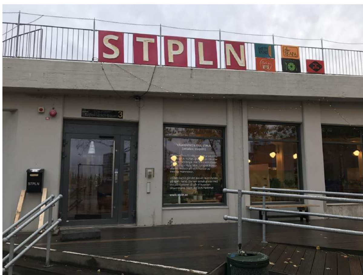
Ingången till Stapln.